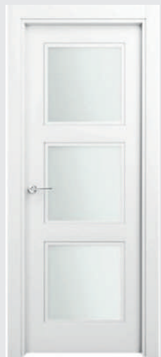
P 12 3V