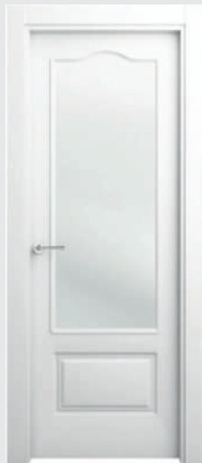
P 5 V