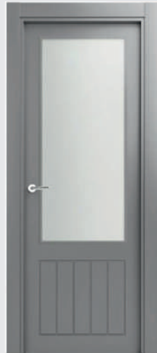
R 50 V