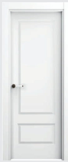
P 1 AR