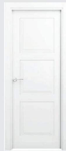
P 12 W