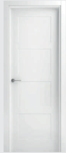
P 13 R