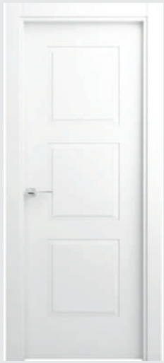
P 12 Z