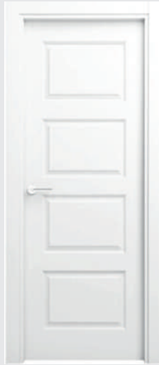
P 13 AR