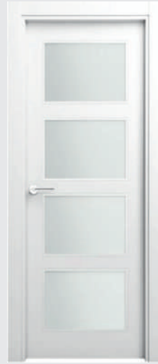
P13 AR 4V