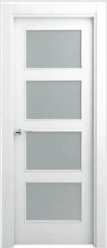
P 13 R 4V