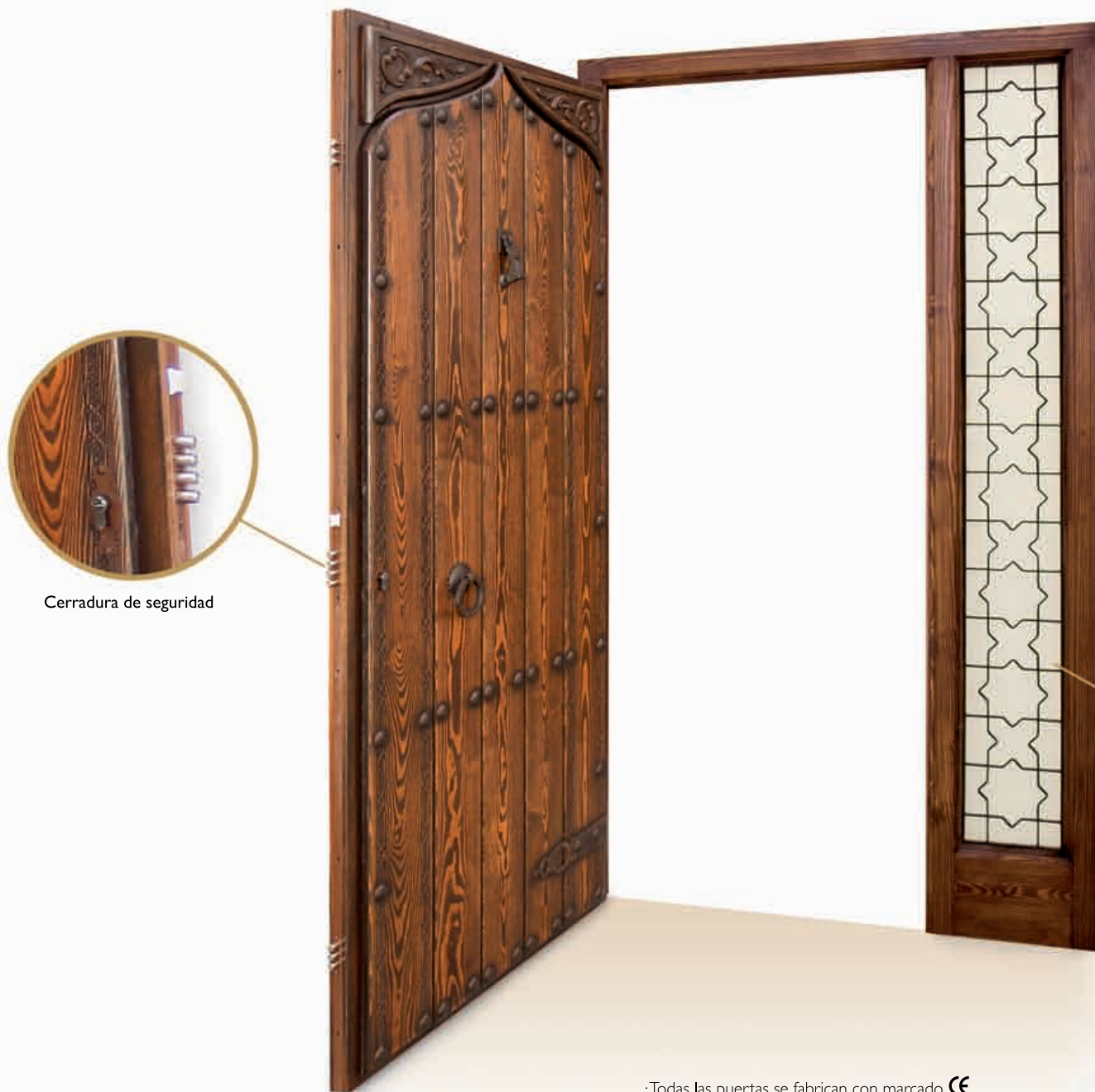
Cerradura de seguridad