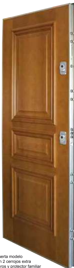
Foto puerta modelo 300 con 2 cerrojos extra delanteros y protector familiar